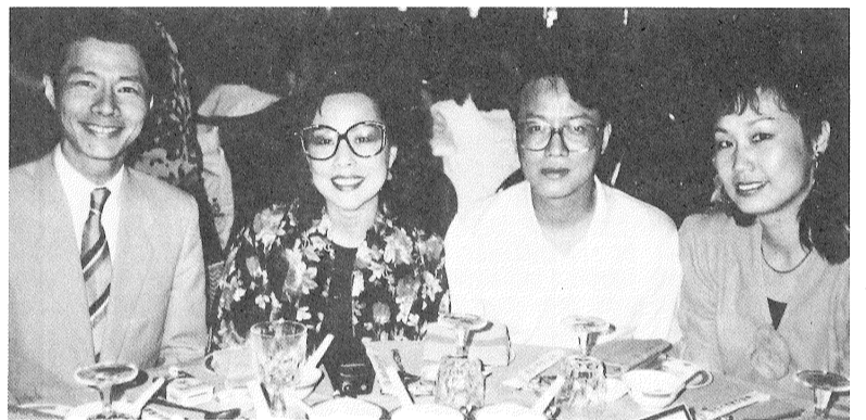
照合莊以章、堂錦林、鳳南、輝兆阮上禮職就和八