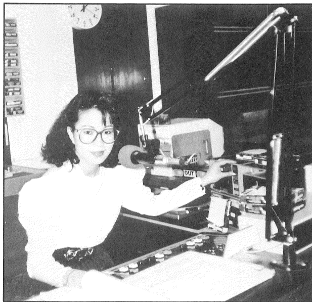
戰挑新一另的作工音播加參