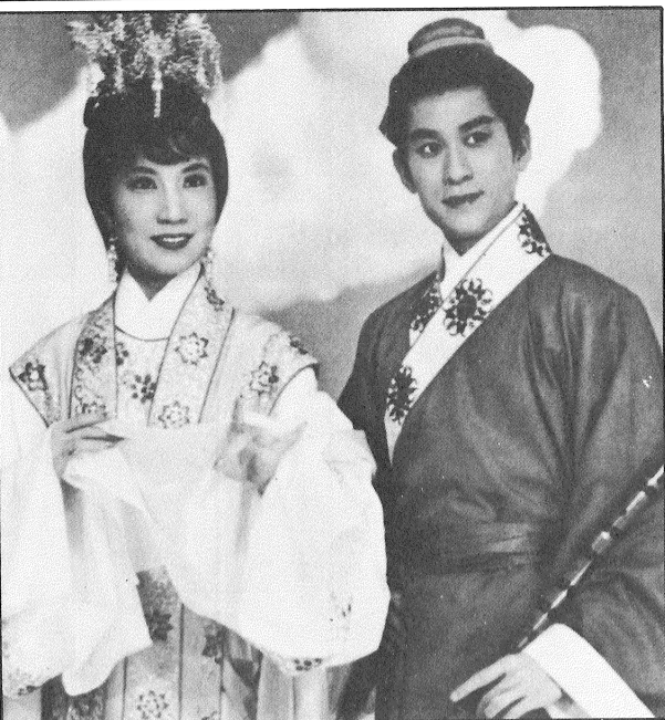
仙橋鶴的唱合登寶李、聲家林前年多

還記得那天的日場是廉收票價，但是演出却是整整的四小時，除了感到物超所值外，粵劇界應是不乏接班人的。