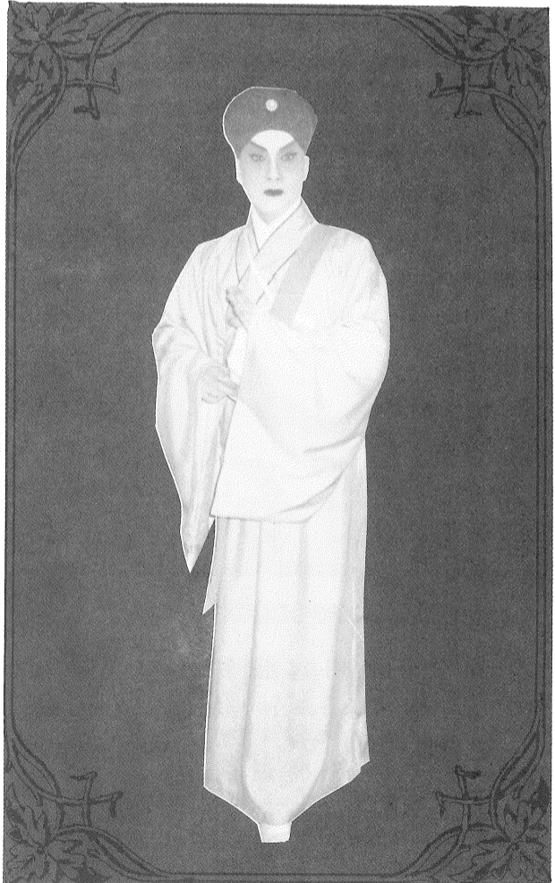
（型造海似深門侯一堂錦林）？過見曾幾尚和的俏俊等這似

劇卅多年來由羅家寶配以不同的花旦，分別在海外及國內演出有超過一千場的紀錄。這不但證明了羅家寶的舞台魅力，在粵劇的歷史中亦留下光榮的紀錄。