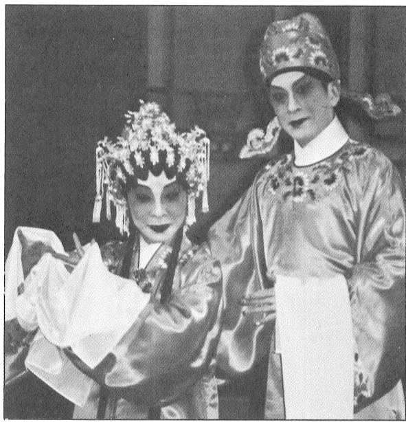
「團劇警新頌」組重迷好陳、警家林