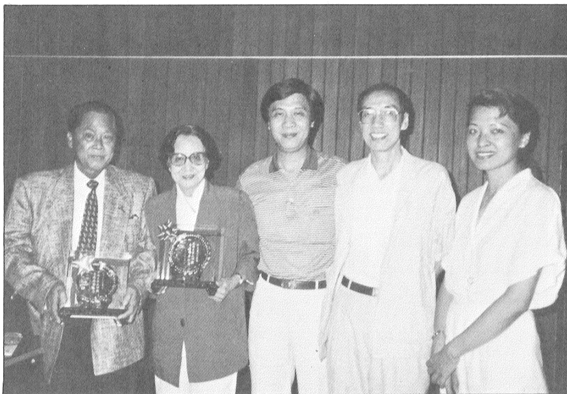
於攝合等生先鍵黎、士女霞孟鄭及師老生粵王與（者立中）平錦范者肇。後之會談坐顧回曲戲生滌唐