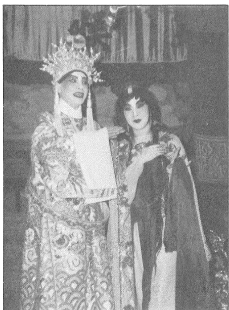
作合輝兆阮與將儀鳳郭秀新深寶

粵劇新人在台上的演出，其實都花了不少的時間和努力，希望他們再接再厲，不難成為粵劇界的中堅分子。 筆者：潘穎茜