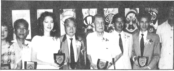
參予區域市政局（楊家將）的紅伶（90年）