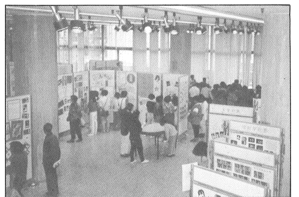
展覽會場中，觀眾川流不息。