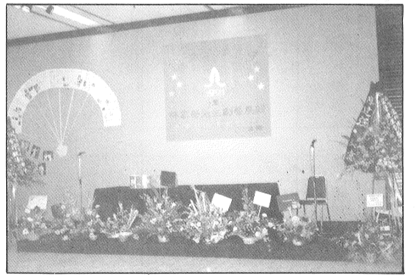
逸林銀禧展覽之禮台佈置

「林家聲先生劇藝展輯」是首個戲迷為偶像舉辦的展覽會，但宣傳却不多，除了在「逸林」報導和印製傳單外，就只有五張手製的海報，可是仍有近千的觀眾聞風而至。（註：此人數乃根據入場簽名冊顯示）展覽會內容主要分三部份：第一部份主要介紹香港聲迷俱樂部會友獻錄的曲詞、劇本，設計更見心思，展品的紀念價值很高，其中包括香港聲迷俱樂部會友獻錄的曲詞、劇本，俱樂部的成立和歷史，第二部份是逸林的歷史和製作；第三部份以路、家、影、劇、視、歌和萬花筒等七方面介紹林家聲。 整個展覽會的內容豐富，設計更見心思，展品的紀念價值很高，其中包括香港聲迷俱樂部會友獻錄的曲詞、劇本，俱樂部的成立和歷史，第二部份是逸林的歷史和製作；第三部份以路、家、影、劇、視、歌和萬花筒等七方面介紹林家聲。