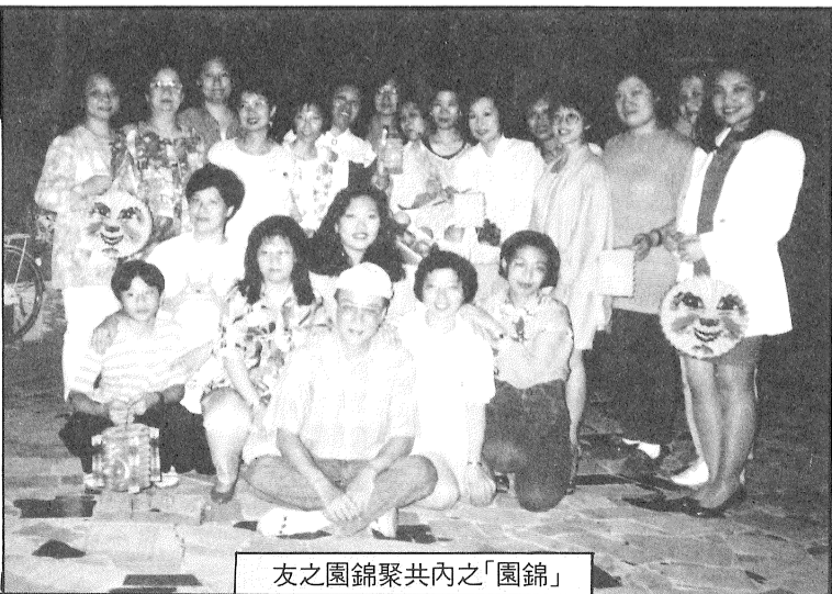
友之園錦聚共內之「園錦」

中秋佳節，明月當空。錦園友誼團一羣姐妹們，齊齊欣賞過「慶鳳鳴」演出的好戲「獅吼記」後，帶著興奮的心情，隨着偶像林錦堂