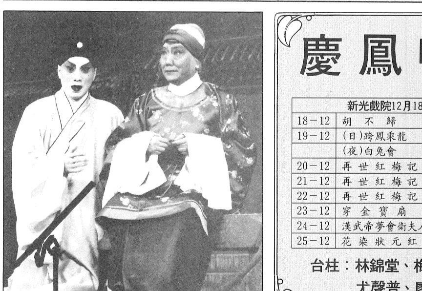
彰益得相子孝的堂錦林、母慈的普聲尤