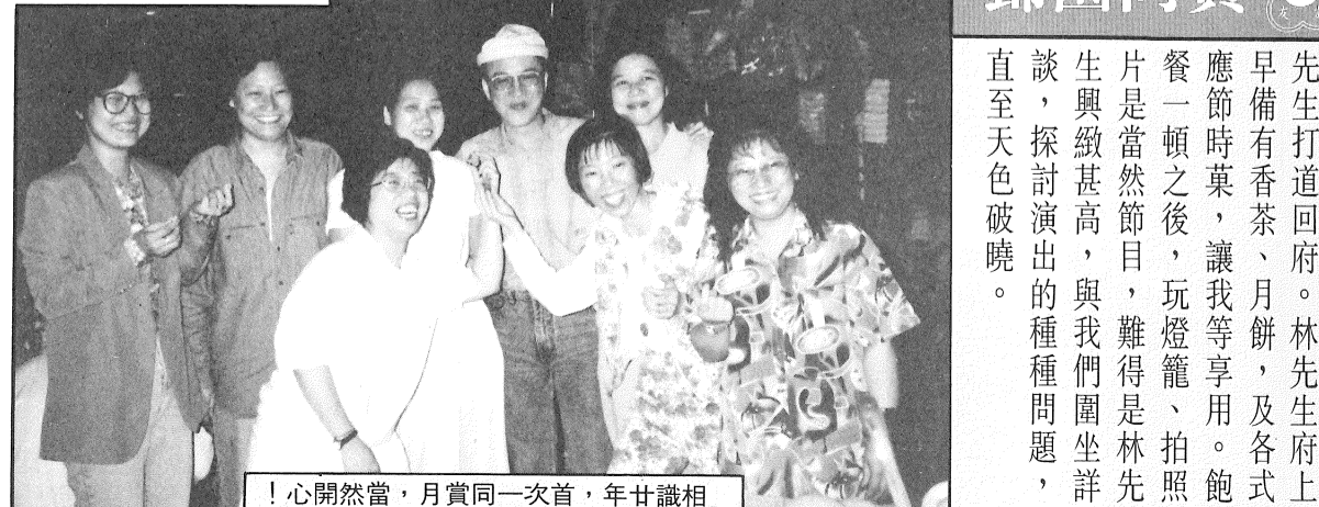
！心開然當，月賞同一次首，年廿識相

只是讚而沒有彈，實要被人罵死呢！但看了三台「慶鳳鳴」的演出，雖然不是十全十美，其中亦有錯漏的地方，但這都是一些小瑕疵，並不影響整個大局，這樣又何須要在雞蛋裏挑骨頭呢！