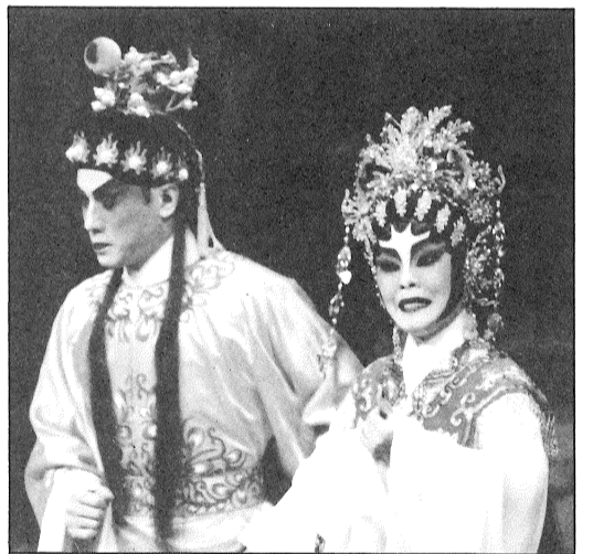
女怨男痴繹演「仙神水洛」

筆者：李淑媛 (編者按——讀者來稿，對新組合的「慶鳳鳴劇團」表示支持，本刊原文照登。圖片提供劉秀民小姐。)