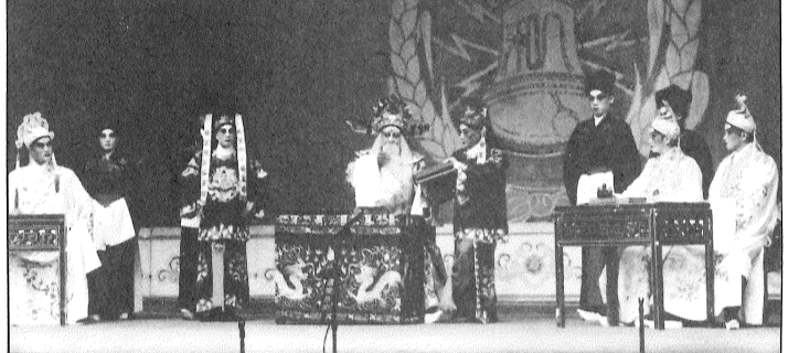
古老排場考試點翰