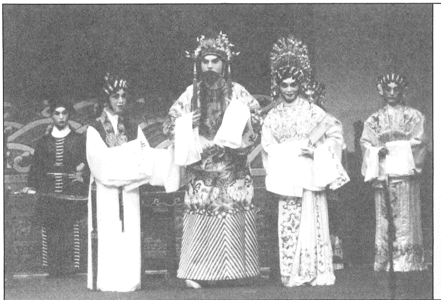
粵藝劇團連續四年參演社區粵劇巡禮