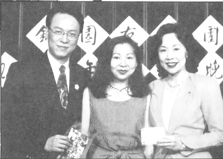
幸運戲迷喜獲林先生送出廿一週年大獎

關注，得到戲迷支持，希望從各路的批判聲中，吸納意見，加以改善，發揮個人風格，將來能廣獲好評。自己會朝着這個目標努力！與他的拍檔更加合拍。