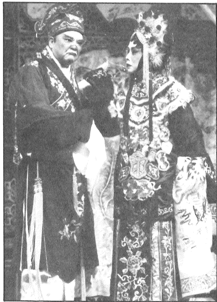
征袍還金粉賽麒麟有水準演出

這齣「封相」，除了有常見的人物，還有幾位時裝打扮的五軍虎。這幾位仁兄，身穿T恤、綢褲、功夫鞋，狀似武術學院學員，他們只是在台上拉馬及打筋斗，對於粵劇做手似乎不太認識，如剛上完速成班便出場，然而他們很落力地打筋斗，跟隨騎馬的演員用馬鞭指示完成演出，他們的打扮雖