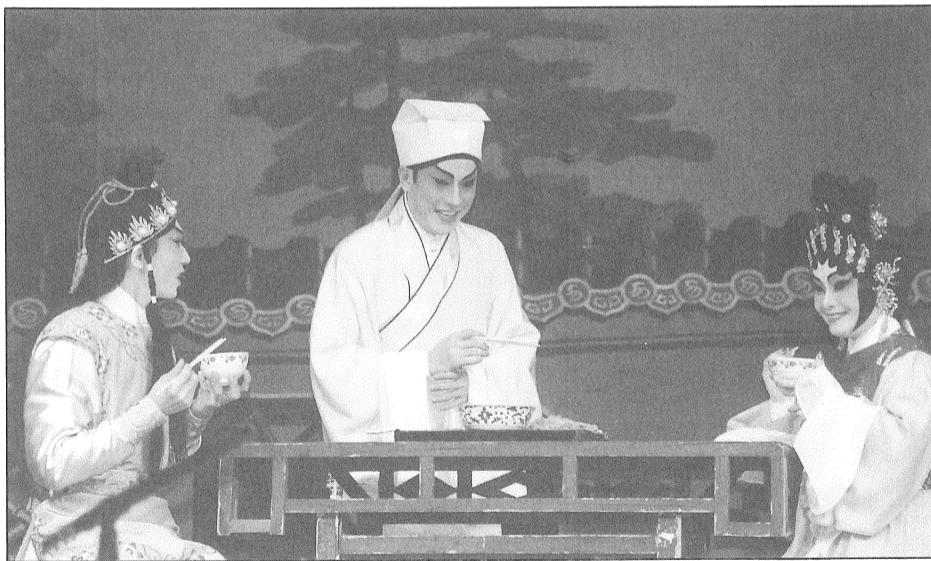
潯陽江上月劇中女主角為示愛，煲出一味紅豆煲蓮藕的靚湯，看圖中各人的笑臉，便知收效。