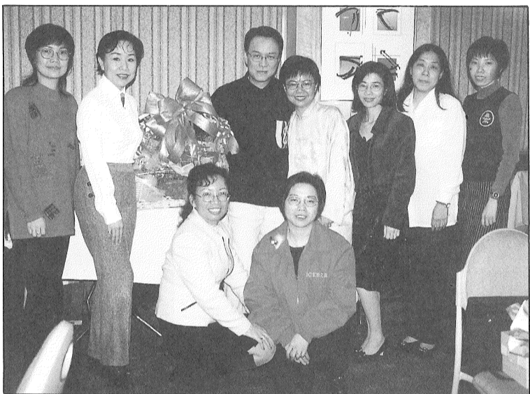
錦園友誼團與兩位偶像團年聚會，由七位元老會員代表送上賀年禮物。