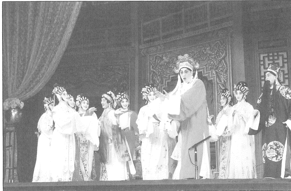
妓院嬉春，羣鶯亂舞的熱鬧場面，是粵劇少見。