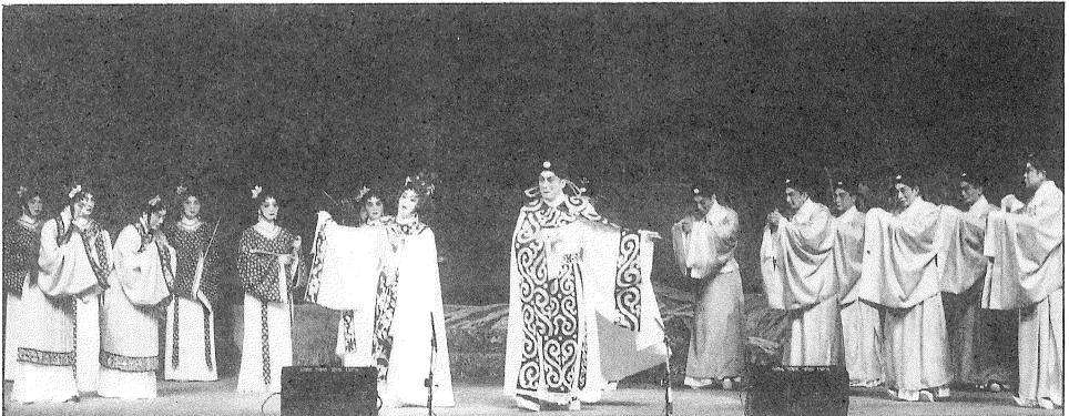
籌款演出首天汪明荃請到未來特區首長董建華作主禮嘉賓，先說一番支持粵劇的美言，繼而拍案一番，此舉是讓一眾支持八和的粵劇觀眾得瞻董建華先生的風采，也大可安心於回歸後大眾仍有粵劇可看，因為董建華先生是支持粵劇的。

紅伶閨秀共高歌 第三晚的粵曲晚會，是以閨秀籌款目標，每位參與演唱的閨秀須捐款廿萬元，便可邀請屬意伶人合唱，故此八和主席汪明荃也獻出第一次舞台上的粵曲演唱，與蔡馬愛滄合唱了一曲「蘇三離別」。久違了的陳好逑與蕭會鳳章一曲「火網梵宮十四年」，迷姐帶着三分病容，依然唱得甜潤動人。大老倌如羅家寶、鍾麗蓉、文千歲、梁少忠等俱能保持優質表現，而業餘者的演出水平，早已不作要求矣！ 九七、三、廿六 筆者：伶伶