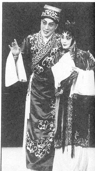
牡丹亭驚夢小夫妻情意綿綿