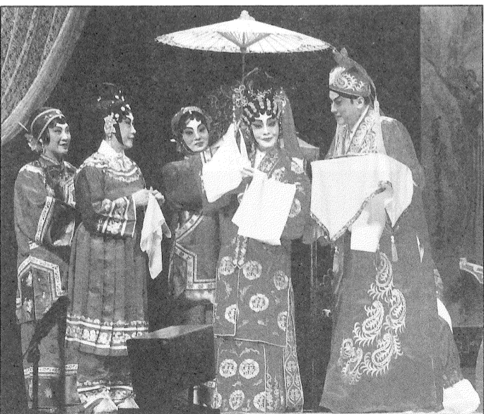
牡丹綠葉相輝映演成好戲——九天玄女