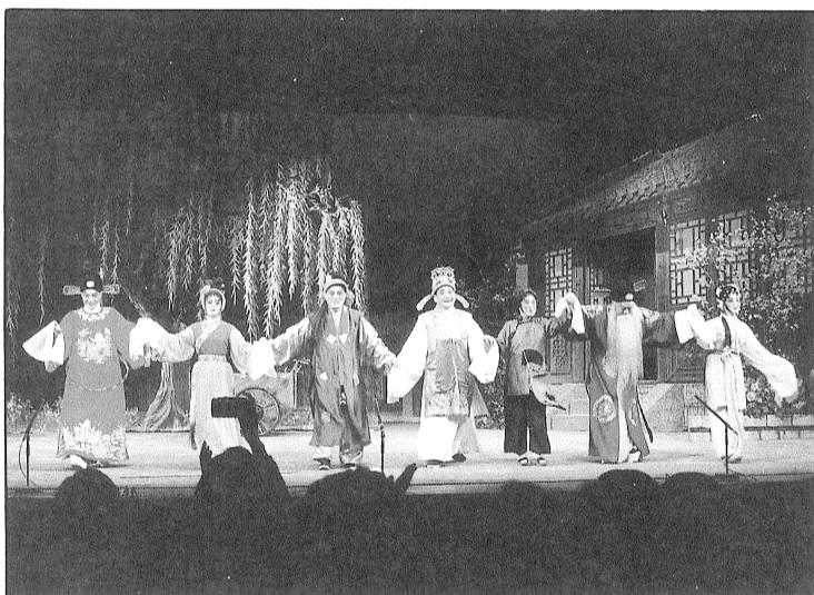
胭脂巷口故人來大團圓結局謝幕