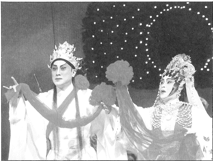
九天玄女帶給慶鳳鳴一個考驗