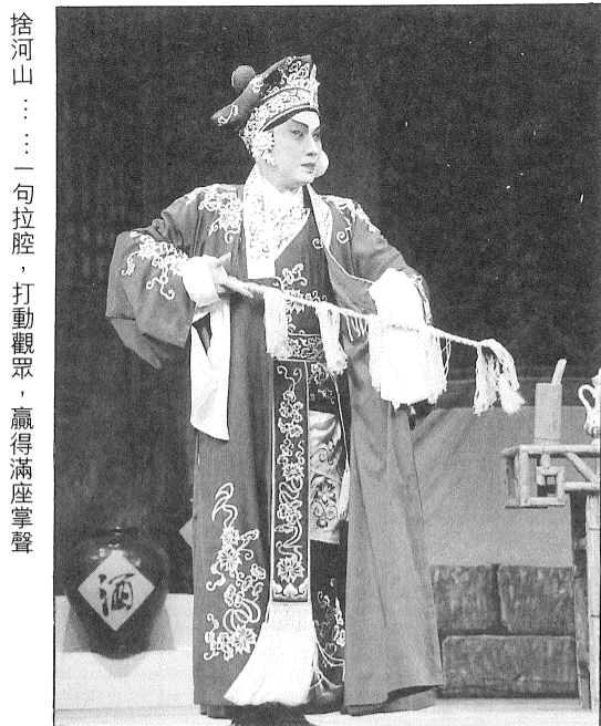
俏潘安來也！展開籌款序幕