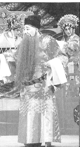
慶鳳鳴劇團一晚好戲共籌得五拾五萬元善款