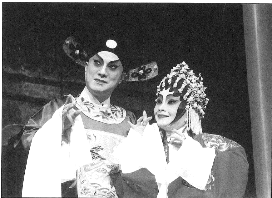
《販馬記》情節有笑有淚