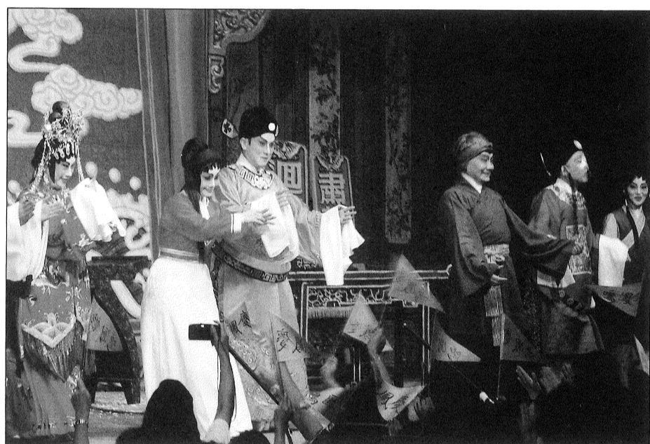
慶鳳鳴戲迷為偶像搖旗喝采（南丫島）