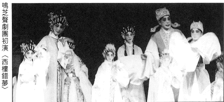
鳴芝聲劇團初演《西樓錯夢》