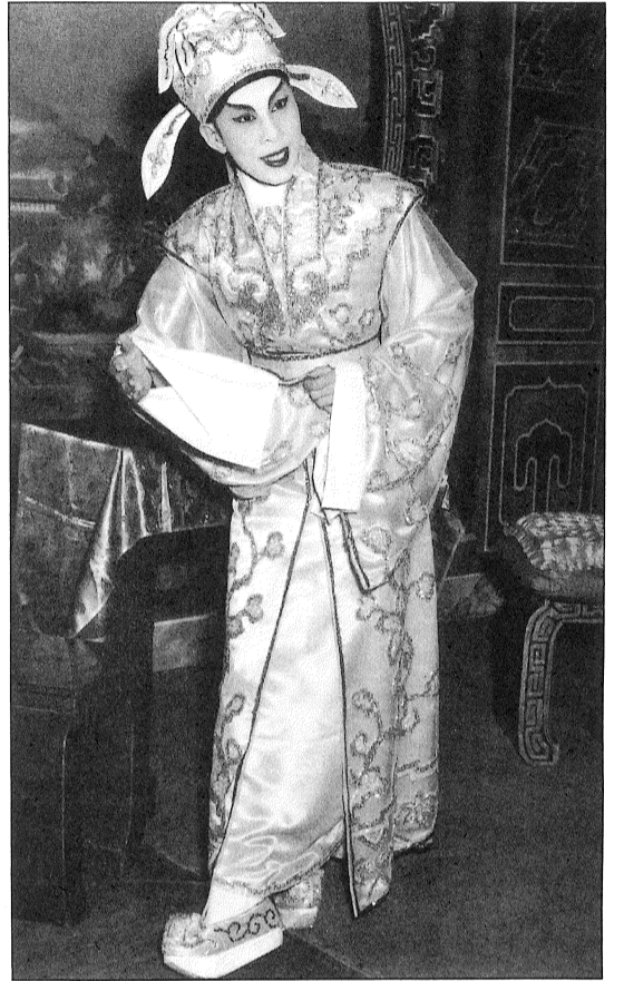
任劍輝《紫釵記》造型 1957年