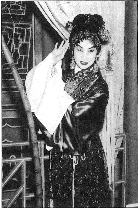
白雪仙《紫釵記》造型 1957年