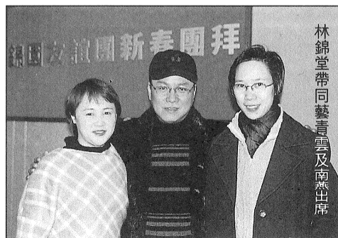
林錦堂帶同藝雲及南露出席

錦園友誼團於二月廿八號（農曆正月廿四日）舉行了一次會員新春團拜。團拜聚會是在錦園廿多年的活動中似是前所未有的，原因則有待查究了。且說回這千禧年的首次活動，選在偶像林錦堂的十九場演出之後，眾人當然話題不絕，從初一講到十六，由新劇情節論到新衫造型，雖然各有不同觀點，但只要是同志同心，講得自然又開心是必然啦！尤以偶像十九場的唱做俱在水準之上，戲迷們自是讚口不絕兼滿意稱心。而部份未有睇足全套的姐妹，忙忙捧著四冊巨形相冊，冀望從劇照中追尋箇中精彩之處。