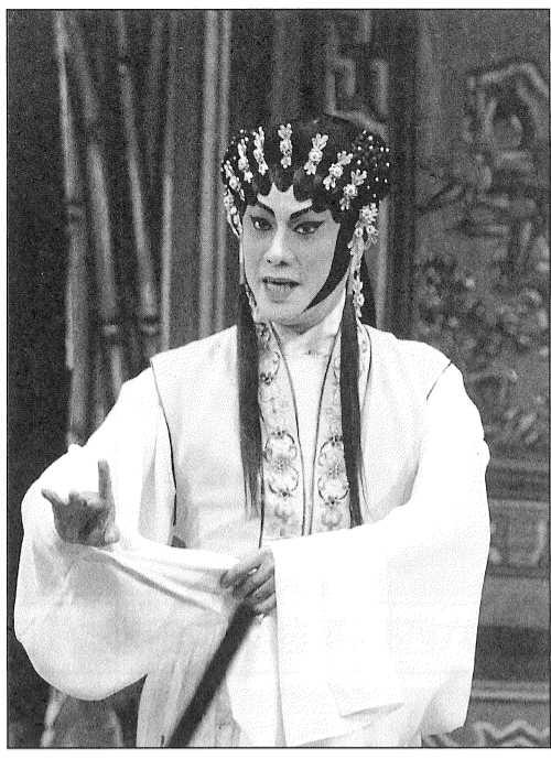
各位觀眾，請看我扮美的新造型 (情俠鬧璇宮)

有說新戲難求，即或間有新作，口碑似也不易建立。查其原因，劇情難有新意，角色塑造也考功夫，再加上曲辭的配合，要迎合觀眾的口味實非易事。因此，改編舊劇就成了另一條可行的路線。因著有本可依，創作的困難可減，而觀眾的信心卻大增。新春期間看「慶鳳鳴劇團」新劇「紅梅白雪賀新春」便可充分印證以上的說法。「紅梅白雪賀新春」改編自任白同名電影，論劇情不算吸引，祇是一般新春喜劇，可能因著「任白」的名牌效應，也可能因為觀眾對劇情了解而增加了觀賞的意欲，三晚演出掛了兩次滿座牌，初二晚的入座率也達九成以上。而入場觀眾不絕的笑聲，也反映該劇的確對了觀眾的口味，營造到熱鬧開心的新春氣氛。