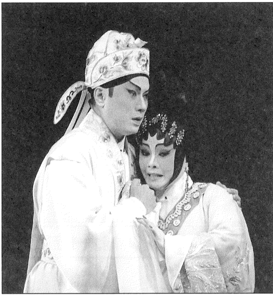
全台最佳演譯當推 (煙雨重溫驛館情)