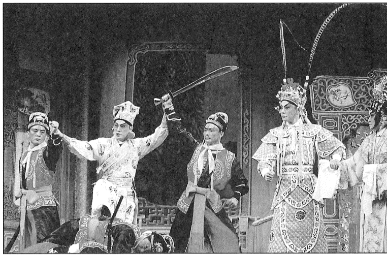
久未有一展身手，且看情俠的威風