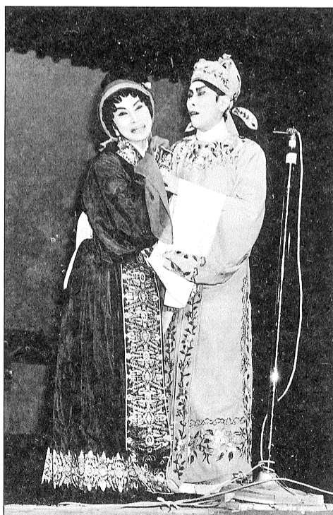
任、白合作勝在感情細膩

劇的另一特色是塑造反派人物；少見有大奸大惡之徒，罪惡之源皆自人性的慾念，因權勢、金錢、貪婪、嫉妒、自私、色慾而一錯再錯，累人害己，這正是人生的反映。到今天環顧世界各地的新聞，每一樁罪案何嘗不是如此由來！各位觀眾在讚賞唐滌生的才情橫溢的時候，可曾體會到唐氏劇作是娛樂與教育結合的創作？ 唐氏劇作特定文化就是把現實人生美化，加上浪漫激情，其劇作的可觀性不止於字字珠璣，絲絲緊扣，更在於言中有物，情真意切，供演員與觀眾有不同的探索空間，因而演員需以感性投入角色，觀眾就以理性角度欣賞。只看一回或只演一次絕不可能領略其中精華，甚至多看也不一定看得透，多演也不等同會演得到，這正是編劇者獨到之處。在此致請各位戲曲知音人，從事戲曲界的演員、編劇者，在各自的崗位內，繼續鑽研，發展唐氏戲曲精神，讓香港的粵劇歷史和戲曲文化上，除了唐滌生、任劍輝、白雪仙之外，也記下你、妳……的名字。 （註：文稿素材原寫於唐滌生逝世四十週年，惟每看唐劇，俱有不同感受，為此加添刪減，至今吐出多年觀感，以期高明賜教。）