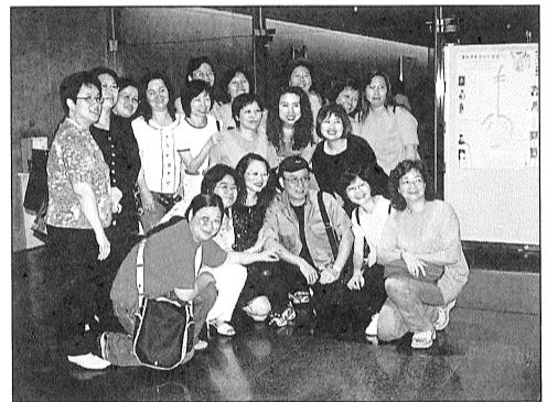
演出成功，戲迷齊與偶像合照留念

演員比平時更抖擻精神，落力演出，將好戲提到更好的層次。因此，雖身在遙遠的對岸，開場前一「撲飛」的現象倒叫人以為重回了熟悉的新光戲院，令該文化中心售票人員也感驚訝。而劇院的設施也起到錦上添花的作用：寬闊舒適的座位令每位觀眾都可以在毫無遮擋下盡情欣賞；新穎的燈光設備也能將豪華繽紛的佈景和精緻的戲服映照得更悅目和富立體感。美中不足的是音響效果未能充分配合，音量略嫌不夠，影響了音樂和唱曲的效果。