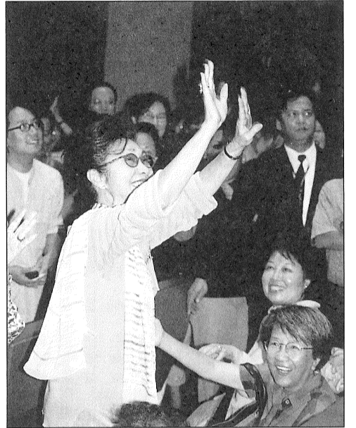
澳門首演之夜，出現了超級偶像白雪仙，中場時揮手回應戲迷時之歡容