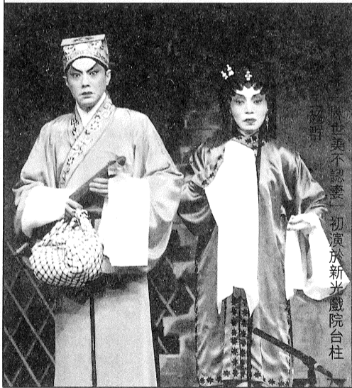
《陳世美不認妻》初演於新光戲院台柱