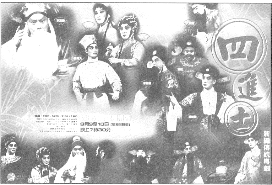
《四進士》再度公演時的宣傳單張展出各演員劇中造型。