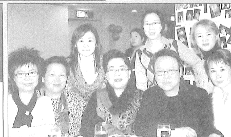
老友記愛徒誼女來來來拍照留念。