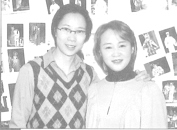
藝青雲與南燕仍須努力。