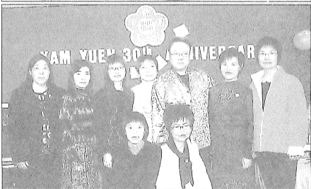
情誼深厚的一群三十年錦園之友。