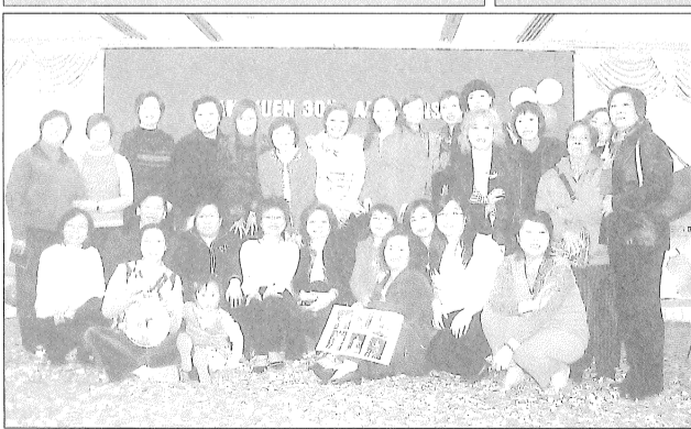
笑一笑世界多美妙。