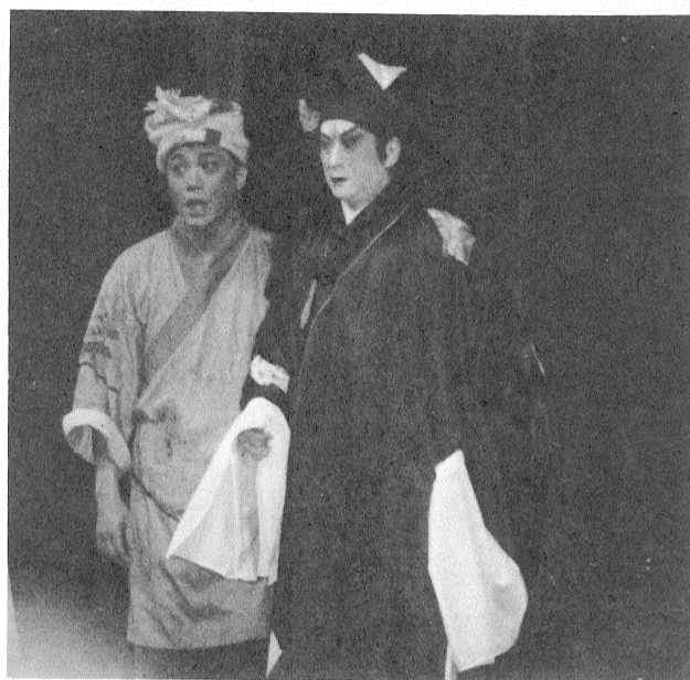
（配樓綵）盛義朱的表意人出個一