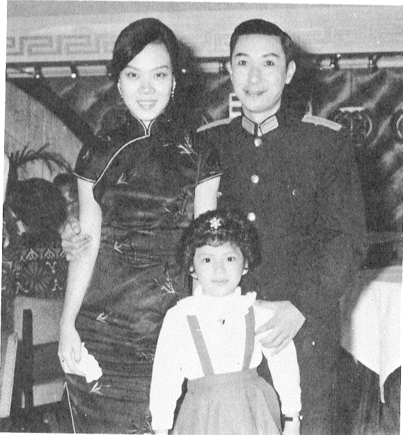
筆者：曾志麗 照片：曾雁鴻

格，也爲人津津樂道。六哥是正宗紅扶子出身，一進入梨園界，就由手下做起，幾經辛苦，後來才晉升到文武生的地位，其間他參加過不少著名的劇團如人壽年及覺先聲等，因此他亦與不少大老伯合作過，從中他吸取了很多演出的經驗，充實了他個人的表演藝術。