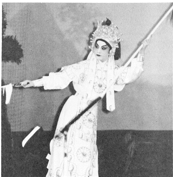
型造的中「蘭木花」在燕飛尹